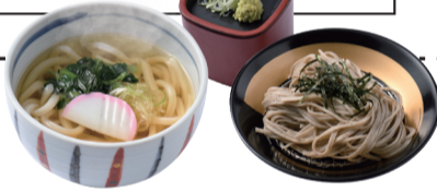
ハーフうどん/ハーフそば(温または冷)